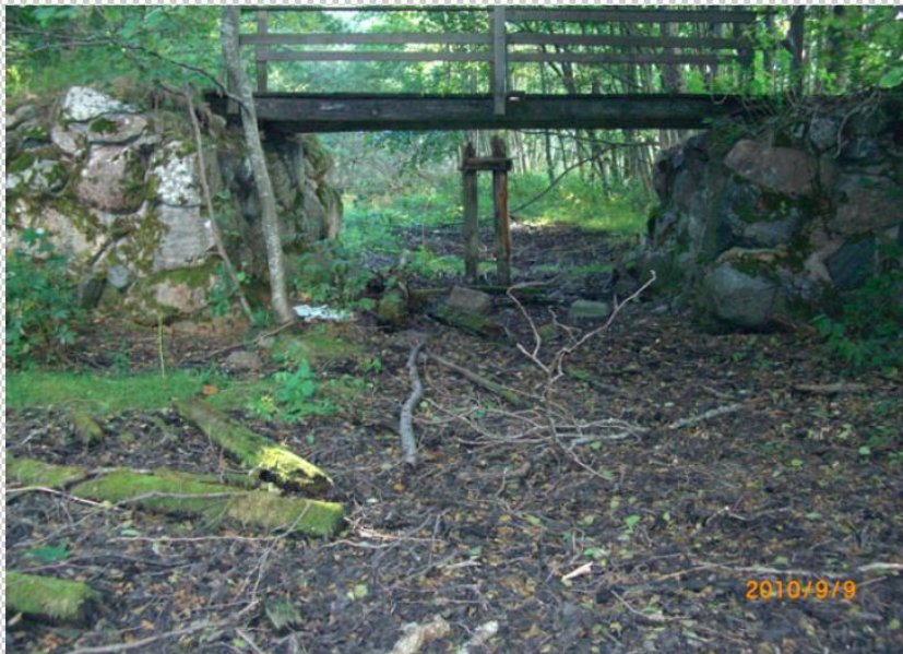
Foto 1 Landfästen till äldre bro, vy från öster

Rester av den rustbädd som landfästena vilar på är synliga.