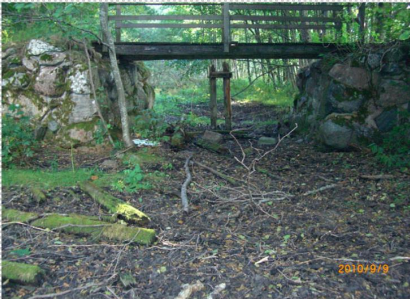
Foto 1 Landfästen till äldre bro, vy från öster

Ljusterö Vatten- och Fiskevårdsförening väntar på att Trafikverket och Österåkers kommun ska nå en överenskommelse om tidplanen för när bron över den nya kanalen kan börja byggas. Brobygget ska samordnas med röjning och muddring av själva kanalen.